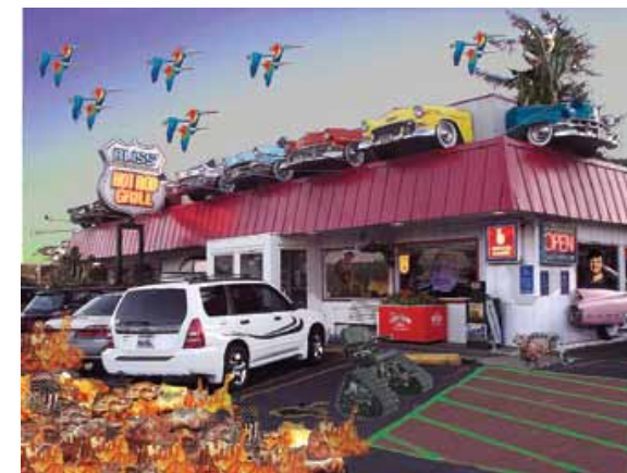
New Beginning for a Dead End USA Redwood Highway, California G. Lofredo (2008)

Cuando el Reta pasa de los popsicles en las estepas de Ucrania a las llantas lisas de la Africana se da cuenta de que le está dando el MPD light, la polifuncionalidad leve, el recurso de la disociación selectiva, eso que en los ensayos puede sucederle a los actores cuando se les cruzan los personajes; y pasa con buenos actores, no crea que sólo a los bisoños. El MPD no es el tipo de comportamiento del Movimiento Popular Democrático de ningún lado. Aunque ahora que lo piensa, quién sabe. Se trata del Multiple Personality Disorder, del que hay tantas subespecies que uno se pregunta para qué le ponen nombre.