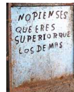
Advertencias Guajiras G. Lofredo (2009)