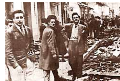
Delegación Estudiantil de Cuba y México Bogotá, 1948

El Reta necesita pellizcarse con un bajativo de hierbas y un tinto fuerte. Se marea con el merengue