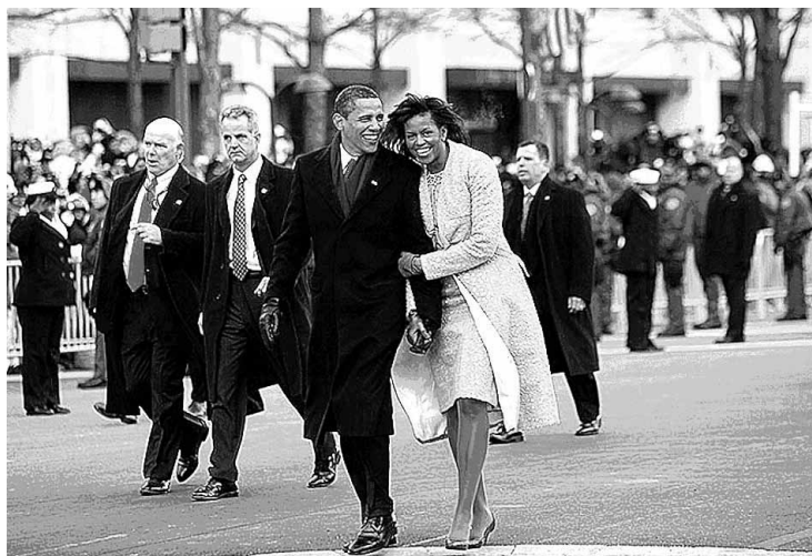
Barack y Michelle Obama. Desfile Inaugural Washington D.C., Enero 20, 2009

al que se manean pegaditos el sexo con la muerte, sobre la mesa, entre las copas y el resto de bigotes batuta del camarón al ajillo, sal, pprika, mantequilla y limn. Es que son tantas las voces y los discursos, de tropicales ritmos, tan bien sustentados, hasta simpticos y convincentes, que al Reta se le mete todo junto a la pelea de gallos, donde si se descuida le sacan a picotazos los ojos y otras cosas que uno debe tratar con cuidado. Y ac viene el patn del Washington Post recin salido de la aspiradora. Una de esas voces que, gracias al MPD, el Reta puede escuchar: